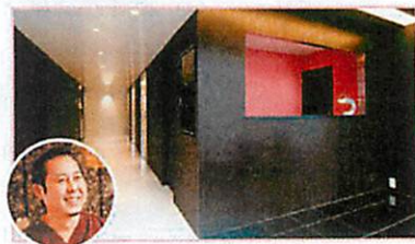
世田谷デンタルオフィス 千歳台インプラントセンター ☎03-3483-4618 世田谷区千歳台5-7-9 1F 千歳台郵便局隣り