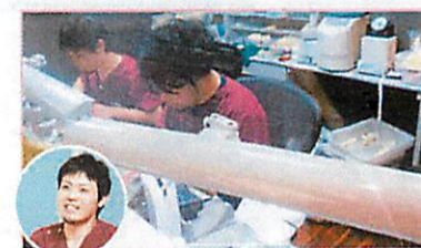
セラミックセンター (白金デンタルオフィス内)