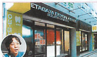
世田谷デンタルオフィス 池尻大橋 池尻大橋インプラントセンター ☎03-5432-4618 世田谷区池尻3-19-1 1F 246号沿い