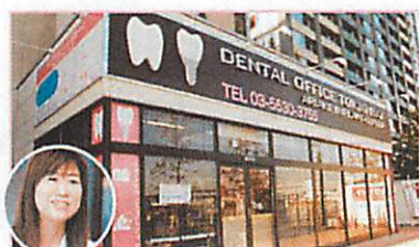
デンタルオフィス東京ベイ 有明インプラントセンター ☎03-5530-3755 江東区有明1-3-17 1F 有明コロシアム交差点