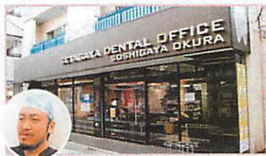
世田谷デンタルオフィス 祖師谷大蔵 祖師谷インプラントセンター ☎03-5429-4618 世田谷区祖師谷3-37-23 1F ウルトラマン商店街沿い