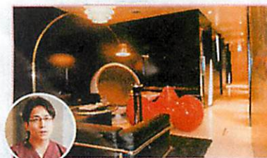
白金デンタルオフィス プラチナ通りインプラントセンター ☎03-3445-9699 港区白金5-2-25 2F プラチナ通り沿い・マルエツの2F